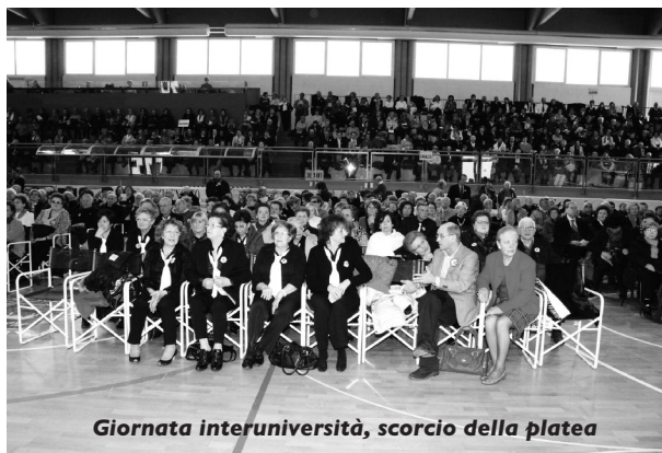
Giornata interuniversità, scorcio della platea