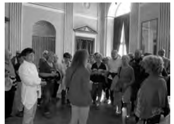
Nella residenza dei reali di Danimarca