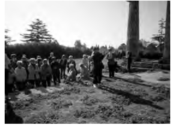
Alle Tavole Palatine