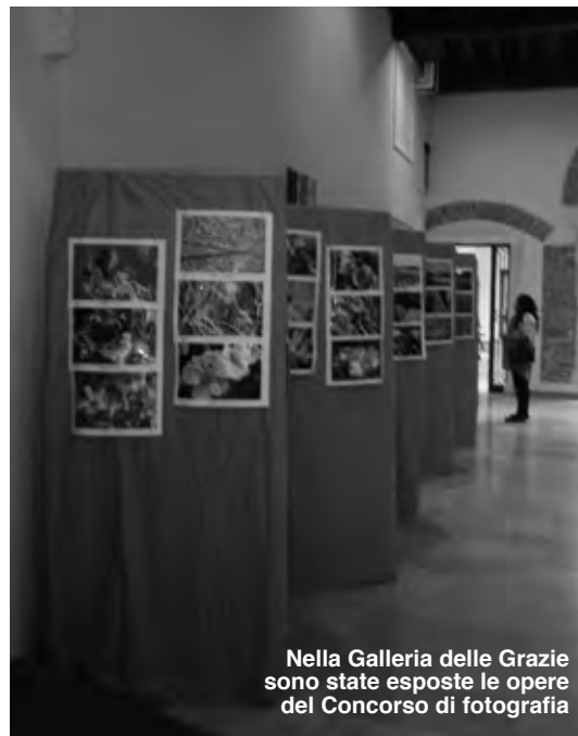
Nella Galleria delle Grazie sono state esposte le opere del Concorso di fotografia