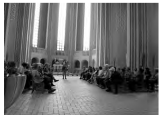
Chiesa della comunità voluta da Grundtvig