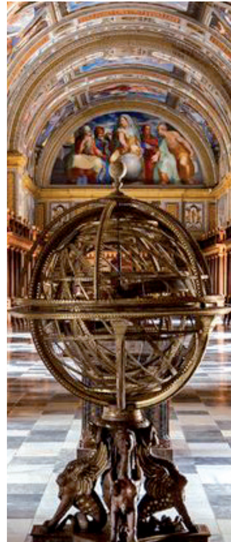
contrà della Racchetta, 9/c Vicenza